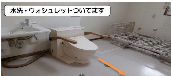
水洗・ウォシュレットついています