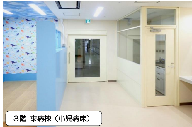
3階 東病棟 (小児病床)