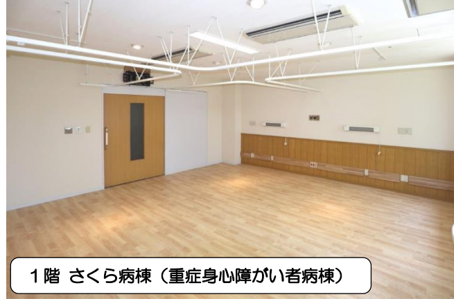
1階 さくら病棟 (重症心身障がい者病棟)

このたび盛岡市青山1丁目の国立病院機構盛岡病院の改修工事を行いました。休棟中で利用されていなかった病棟の改修整備を行い、40床が運用できるようになりました。岩手県内で医療的ケアが必要な18歳以上の重症心身障がい児・者の方々が入所できる施設は近年満床状態であり、その解消を図ります。また、本館棟3階 東病棟の食堂であったスペースは、8床の小児専用・及び入院救急医療として機能できるように整備され、この改修を機に病院名も盛岡医療センターと改称されました。