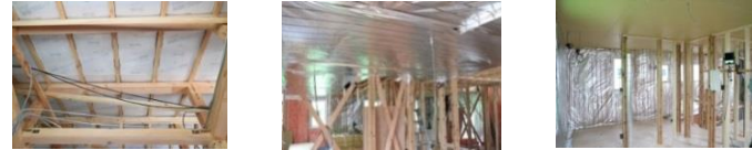
屋根裏断熱材 天井断熱材 内壁断熱材