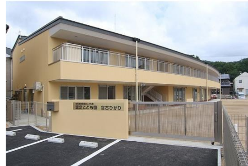
認定こども園 宮古ひかり