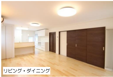
リビング・ダイニング