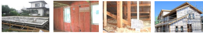
基礎断熱材 10 cm 壁断熱材 10.5 cm 天井裏断熱材 30 cm 外壁下地断熱材